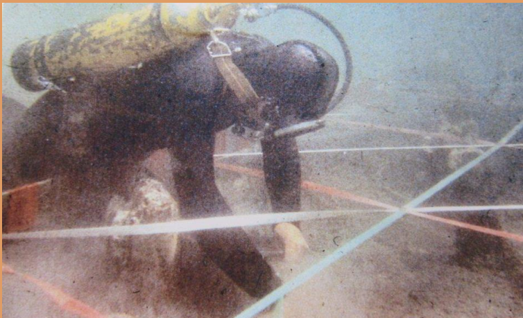
Fouille subaquatique - - Charavines il y a 5000 ans