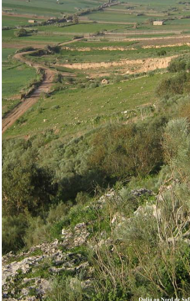
Oulja au Nord de Safi