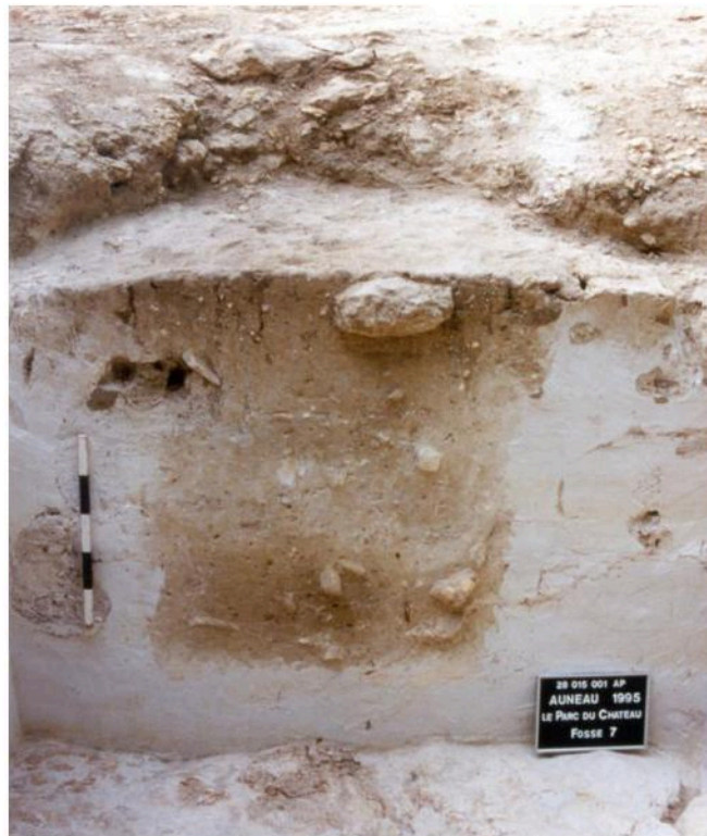
Le Parc du Château - Auneau : fosse de stockage (Fosse 7)

La récolte en masse, la conservation et le stockage des noisettes, abondantes dans la première moitié du Mésolithique, auraient permis à ces groupes humains de s'affranchir des cycles saisonniers et de s'installer durablement dans des lieux privilégiés, propices à la chasse et la récolte de végétaux, comme à Auneau.