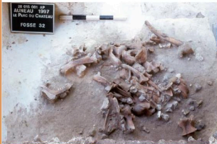
Le Parc du Château - Auneau : en haut fosse d'extraction de grès (Fosse 47) en bas fosse dépotoir (Fosse 32)

Les populations mésolithiques (entre 9700 et 5000 ans av. J.-C.) sont réputées être nomades, à l'image des peuples de la fin du Paléolithique, ce qui est en contradiction avec la mise en évidence de structures pouvant témoigner d'installations de longue durée. À côté de populations de chasseurs-collecteurs encore très mobiles, des groupes humains auraient pratiqué le stockage de fruits à coque (noisettes, glands...) dans de grandes fosses creusées dans le sol.